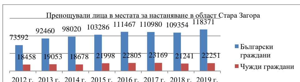
Фигура 3: Пренощували лица в местата за настаняване в област Стара Загора за периода 2012-2019г.

Информацията за броя на пренощуващите лица в местата за настаняване в област Стара Загора за периода 2012-2019г. е представена на Фигура 3. От представените на нея се забелязва нарастваща тенденция в числеността на пренощуващите лица в изследвания район. От 73592 български граждани през 2012г. броят им се е увеличил до 118371 през 2019г. Чуждестранните граждани през 2012г. са били 18458, а през 2019г. достигат 22251.