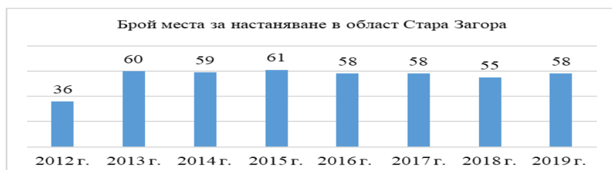
Фигура 1: Места за настаняване в област Стара Загора за периода 2012-2019г.

и/или не са залегнали в различните стратегически документи, но в следващи проучвания ще бъдат разгледани.