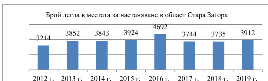
Фигура 2: Брой легла в местата за настаняване в област Стара Загора за периода 2012-2019г.

На Фигура 2 е представена информацията относно броя на леглата в местата за настаняване в област Стара Загора за периода 2012-2019г. Забелязва се, че от 2012г. до 2016г. той нараства, като през 2016г. е най-висок – 4692. През следващите години започва да се понижава – през 2017г. достига до 3744, през 2018г. – 3735, а през 2019г. е 3912. През последната година се забелязва плавно увеличение в броя на леглата в местата за настаняване, което кореспондира и с увеличението на самите места за настаняване (виж Фиг. 1).