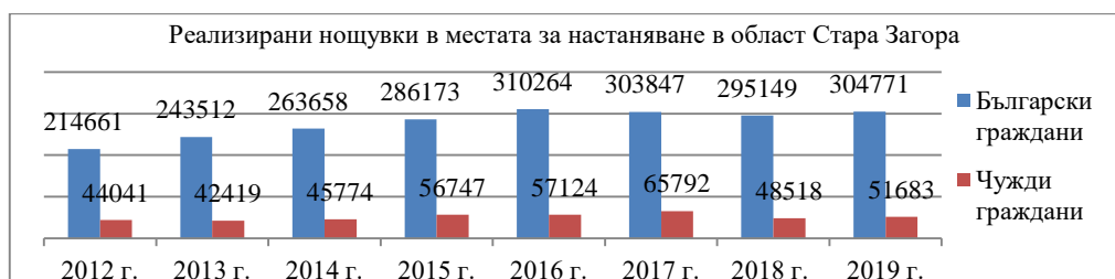
Фигура 4: Реализирани нощувки в местата за настаняване в област Стара Загора за периода 2012-2019г.

Реализираните нощувки в местата за настаняване на територията на областта за изследвания период са представени на Фигура 4, която ни показва отново нарастваща тенденция, кореспондираща с представените данни от Фигура 3. Именно реализираните нощувки са показателят, който се отнася до реалното търсене в рамките на отчетния период. В случая през 2016г. е имало „пик“ в търсенето от български граждани и са реализирани 310264 нощувки и се отнася до обема на вътрешния туризъм в страната. През 2017г. „пикът“ е бил от търсене на чуждестранни граждани – 65792 реализирани нощувки. Това е показател, който отчита значението на международния туризъм за България.