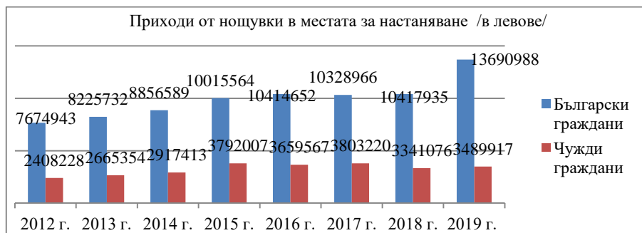
Фигура 5: Приходи от нощувки в местата за настаняване /в левове/ в област Стара Загора за периода 2012-2019г.

От Фигура 5 става ясно, че най-високите приходи от нощувки в местата за настаняване в област Стара Загора са през 2019г. от български граждани, като възлизат на 13690988 лв. През 2017г. са най-високите приходи от чуждестранни граждани в размер на 3803220 лв.