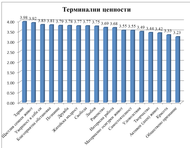
Графика 1 Терминални ценности

доброто качество на живот, психическо и физическо здраве на индивида.