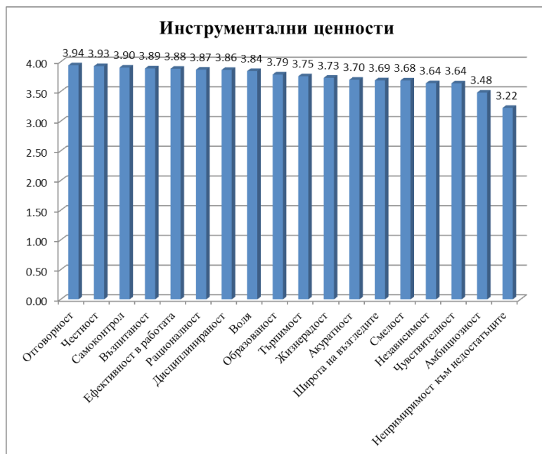
Графика 2 Инструментални ценности

Съгласно методиката, под внимание се взимат само трите най-силно изразени ценности. В случаят те са: Отговорност, Честност, Самоконтрол. Това са трите най-важни инструментални ценности за анкетираните.